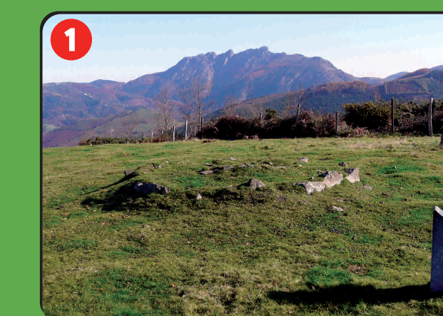
1 Elorrietako kasko mairubaratza Cromlech de Elorrietako kaskoa Cromlech d'Elorrietako kaskoa