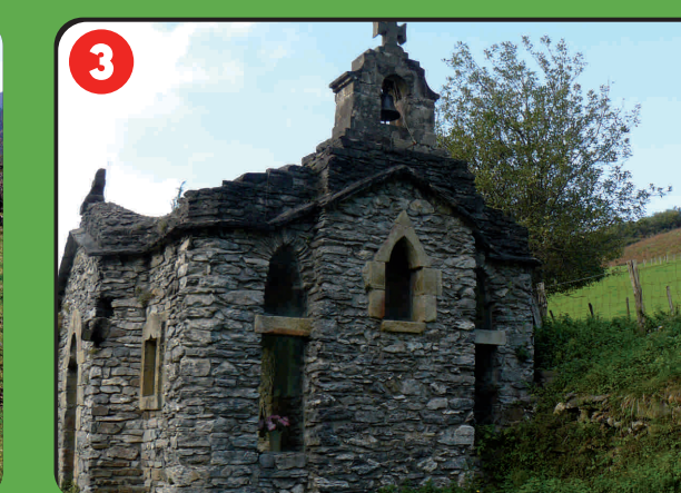
3 Ozentzioko ermita Ermita de Ozentzio Petite église d'Ozentzio