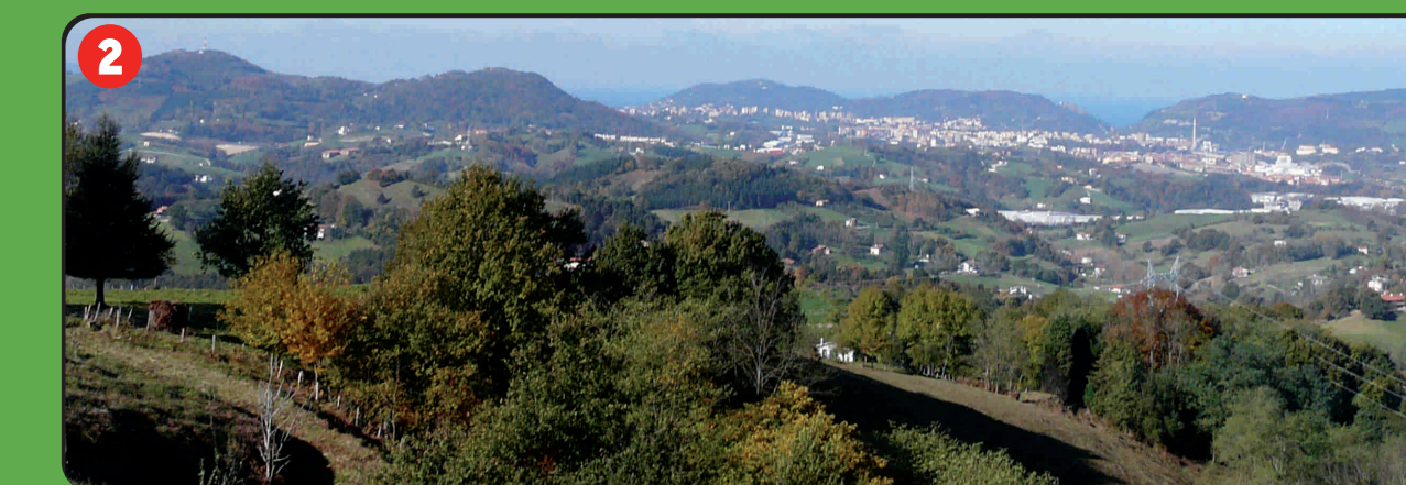
2 Ikuspegi panoramikoa Vista panorámica Vue panoramique